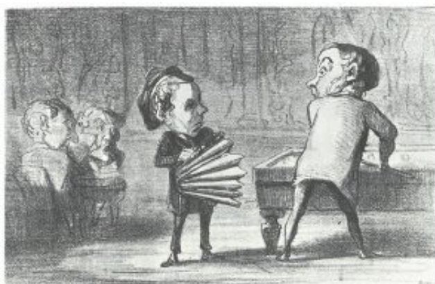
— L'ACCORDEON, DIT SOUFFLET À MUSIQUE. — — On n'a pas encore le droit de tuer les gens qui jouent de cet instrument, mais il faut espérer que cela viendra. —

« On n'a pas encore le droit de tuer les gens qui jouent de cet instrument, mais il faut espérer que cela viendra. »